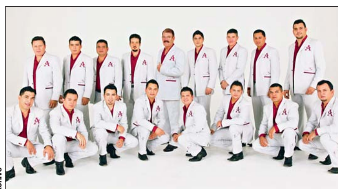
De regreso. La banda se presentará en julio en la Feria de Torreón.